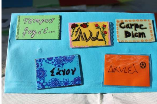
Taller de imanes