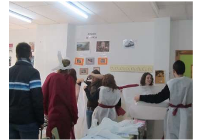
yo conozco mi herencia