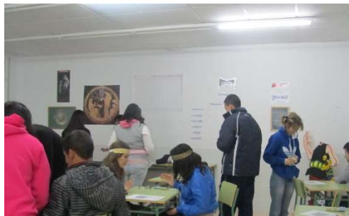
taller de juegos romanos